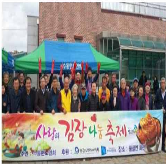
▲ 수동면노인회 김장봉사

남양주 수동면노인회(회장 이희원)는 지난 10일 수동면에 위치한 물골안 회관에서 남양주시각장애인협회에 전달하는 '사랑의 김장김치 나눔 축제' 행사를 했다.