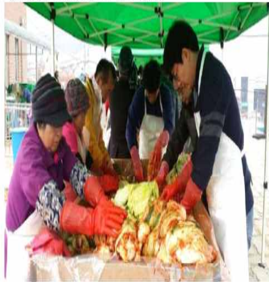
▲ 수동면노인회 김장봉사

전에 자매결연을 체결해 매년 김장시기가 되면 배추를 절구는 일정부터 마무리하는 봉사활동을 펼쳐오고 있다. 행사는 시 도시농업공동체 등록에 따른 남양주시 유기농업과의 지원으로, 시유지 땅 10만2천㎡ 농경지를 활용해 배추 1만 포기와 무 2천 개를 경작, 생산한 농작물을 4일간의 일정으로 배추 500포기를 절구고 절인 김장김치 100박스를 마련했다.